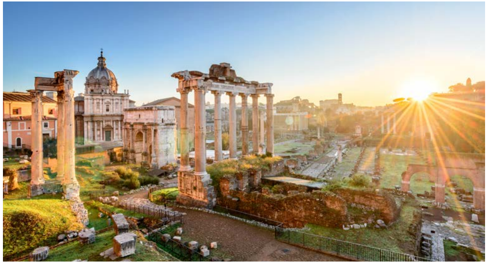
Forum Romanum in Rom

Am Vormittag können Sie die romantische Seite von Rom kennenlernen. Auf der breiten „Spanischen Treppe“ an der Piazza di Spagna herrscht stets Hochbetrieb. Wer Rom wiedersehen will, wirft eine Münze in die Fontana di Trevi, einen kunstvollen