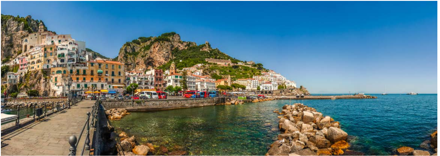
Zauberhafte Ausblicke auf Amalfi