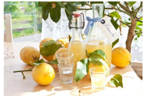
Limoncello – einfach köstlich

Flugplan-, Hotel- und Programmänderungen vorbehalten. An- und Abreisetag dienen ausschließlich der Erbringung der vertraglichen Beförderungsleistungen. Je nach Fluggesellschaft und Flugdauer werden Bordverpflegung und Getränke nur gegen Bezahlung angeboten. Stand 08/20 – alle Angaben ohne Gewähr.