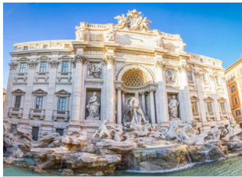
Der Münzwurf am Trevibrunnen – ein Muss!

Barockbrunnen von Nicolo Salvi aus dem 18. Jh. Auf der Piazza Colonna sehen Sie die herrliche Säule des Marc Aurel, auf der Piazza di Pietra die Ruinen des Hadriantempels. Schließlich gelangen Sie zum besterhaltenen Bauwerk des antiken Roms, dem Pantheon, dessen Grundstein aus dem Jahre 27 n. Chr. datiert. Noch heute gilt der Kuppelbau als Musterbeispiel altrömischer Baukunst. Anschließend begeben Sie sich zur wunderschönen Piazza Navona mit der reich dekorierten Barockkirche Sant Agnese in Agone. Hier steht der berühmte Brunnen von Bernini „Fontana dei quattro Fiumi“, der die Flüsse Donau, Nil, Ganges und Rio de la Plata symbolisiert. Nutzen Sie den Nachmittag für einen entspannten Cappuccino in einem der zahlreichen Straßencafés oder lassen Sie sich durch das quirlige Rom treiben.