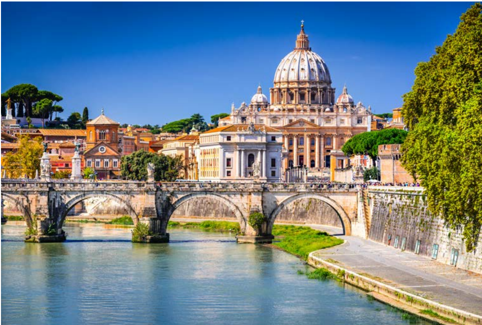
Die Engelsbrücke in Rom