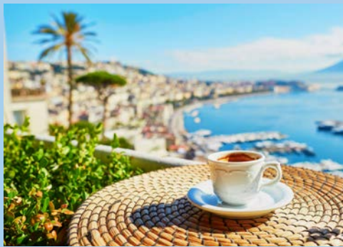
Genießen Sie „la dolce vita“

„La Dolce Vita“ – schon Johann Wolfgang von Goethe wusste seit seiner Italienreise im Jahr 1786 die italienische Lebensart, das milde Klima und die Kunstschätze Roms zu schätzen. Entdecken Sie die „ewige Stadt“ und ihre 3.000-jährige Geschichte und lassen Sie sich von der Fülle an Sehenswürdigkeiten verzaubern: Petersdom, Vatikan mit Sixtinischer Kapelle, Forum Romanum, Kolosseum... Im zweiten Teil Ihrer Reise erkunden Sie die antike Stadt Pompeji, kosten von dem leckeren Limoncello, dem „Nationalgetränk“ der Region Kampanien, und entdecken die malerische Region rund um Sorrent. Auf einem optionalen Ausflug können Sie außerdem die Schönheit der weltbekannten Amalfiküste entdecken.