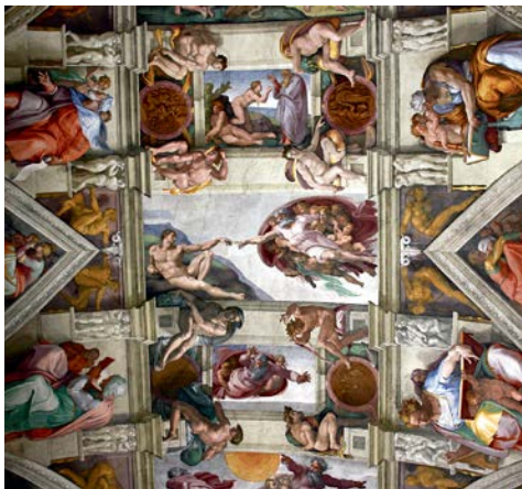
Sixtinische Kapelle – faszinierend

Barockbrunnen von Nicolo Salvi aus dem 18. Jh. Auf der Piazza Colonna sehen Sie die herrliche Säule des Marc Aurel, auf der Piazza di Pietra die Ruinen des Hadriantempels. Schließlich gelangen Sie zum besterhaltenen Bauwerk des antiken Roms, dem Pantheon, dessen Grundstein aus dem Jahre 27 n. Chr. datiert. Noch heute gilt der Kuppelbau als Musterbeispiel altrömischer Baukunst. Anschließend begeben Sie sich zur wunderschönen Piazza Navona mit der reich dekorierten Barockkirche Sant Agnese in Agone. Hier steht der berühmte Brunnen von Bernini „Fontana dei quattro Fiumi“, der die Flüsse Donau, Nil, Ganges und Rio de la Plata symbolisiert. Nutzen Sie den Nachmittag für einen entspannten Cappuccino in einem der zahlreichen Straßencafés oder lassen Sie sich durch das quirlige Rom treiben.