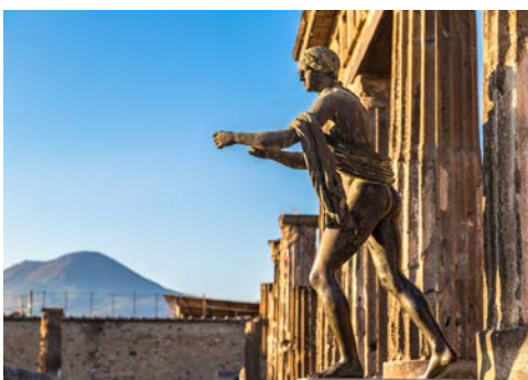
Die antike Stadt Pompeji

Am Vormittag besichtigen Sie Pompeji. 20 km südlich von Neapel am Fuße des Vesuvs liegt die antike Stadt, die im Jahre 79 n. Chr. durch den Ausbruch des Vulkans verschüttet wurde. Konserviert durch meterhohe Ascheberge präsentiert sich Pompeji heute als eine der besterhaltensten Städte der Antike. Lassen Sie sich während der ausführlichen Besichtigung der Ausgrabungen in die Lebensweise der alten Römer einweihen. Im Anschluss besuchen Sie eine Limoncello Fabrik. Von der Panoramaterasse des Hauses, kurz vor Positano, genießen Sie einen atemberaubenden Blick über die einzigartige Küste. Bei einer Verkostung können Sie das köstliche „Nationalgetränk“ der Region probieren. Im Anschluss erfolgt die Weiterfahrt nach Sorrent. Während einer Stadtbesichtigung lernen Sie den zauberhaften Küstenort kennen. Rückkehr zum Hotel.