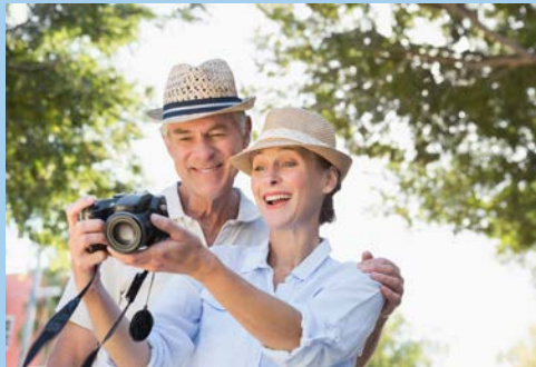
Unterwegs auf Entdeckungstour