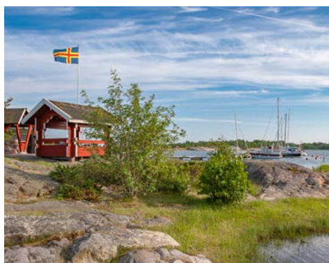
Idylle auf den Åland-Inseln

Die historische Altstadt Tallinns wird vom achteckigen Turm des mittelalterlichen Rathauses überragt, das zugleich das älteste in Nordeuropa ist. Zahlreiche Handelskontore, Kirchen, Bürgerhäuser und der Stadtmagistrat erinnern an die Zeit der Hanse. Vom Burgturm haben Sie einen Ausblick über die Altstadt mit ihren engen Gassen bis zu den Befestigungsanlagen der Toompea-Burg und zur Küste.