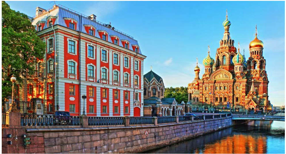
St. Petersburg ist eine faszinierende Stadt, für die Sie drei Tage Zeit haben