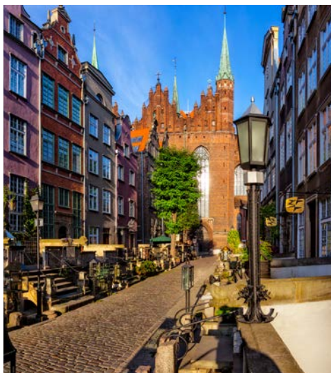
Die Danziger Altstadt lädt zum Staunen ein