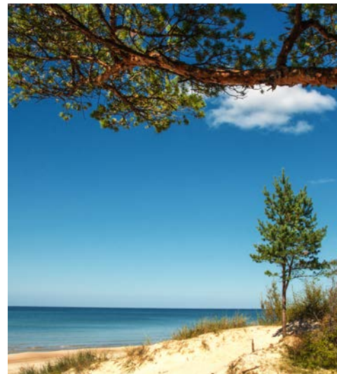
Vor den Toren Klaipedas liegt die Kurische Nehrung