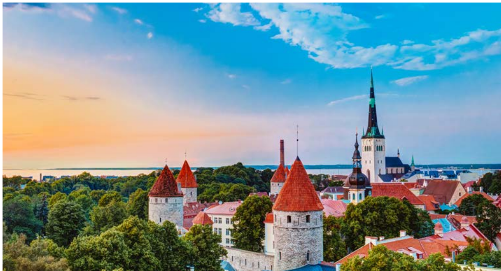
Die Stadt der Türme – Tallinn – macht ihrem Namen alle Ehre