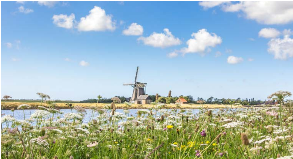
Impressionen auf Texel