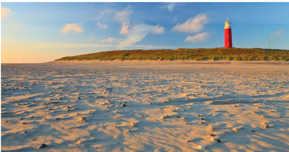
Wunderschöne Strandlandschaften auf Texel