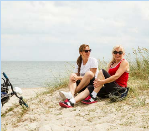
Erleben Sie Meer, Wind und Sonne