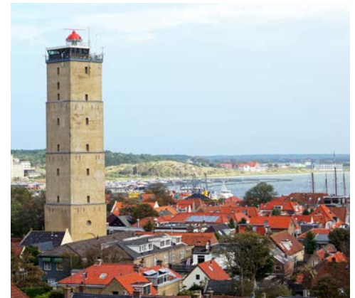
Der Leuchtturm „Brandaris“ in West-Terschelling

Im Laufe des Nachmittags wird Ihr heutiges Reiseziel, die Insel Terschelling, auch bekannt unter dem Namen „Amsterdam des Wattenmeeres“, erreicht. Die hübschen Dörfchen auf der Insel haben viel von ihrem alten Charme behalten. Wenn das Wetter es zulässt, wird heute an Deck anstelle des Abendessens das Mittagessen serviert. Es besteht die Möglichkeit, sich für den Abend Sandwiches zu machen oder Sie erkunden auf eigene Faust die vielen netten Restaurants und Kneipen an Land.