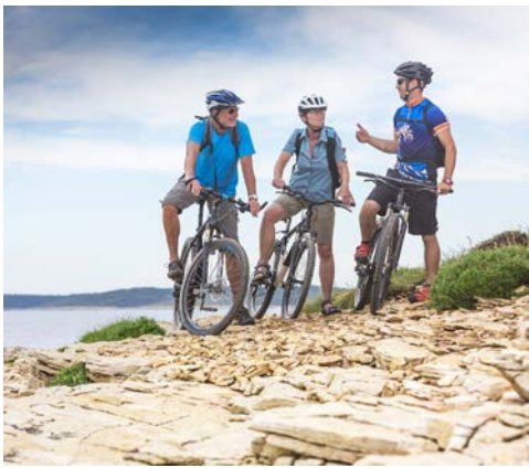
Freuen Sie sich auf schöne Fahrrad-Touren