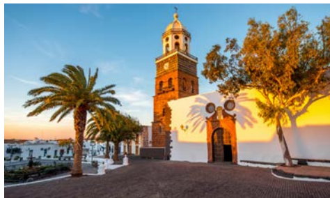
Eine echte Schönheit – Teguise