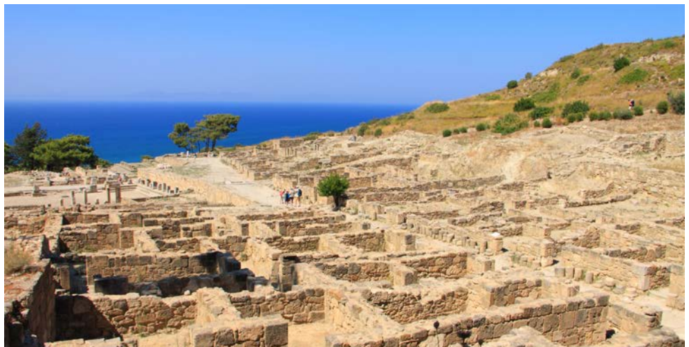
Ausgrabungen von Kamiros

Frühstück im Hotel. Heute erleben Sie auf dem buchbaren Ausflug das noch ursprüngliche Leben auf Rhodos, wie es schon seit Jahrhunderten von Generation zu Generation weitergegeben worden ist. Sie erleben die Naturschönheiten des Tals der sieben Wasserquellen und des Profitis Ilias-Pinienwaldes. In