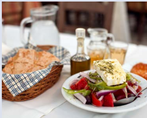
Griechische Küche – einfach lecker!