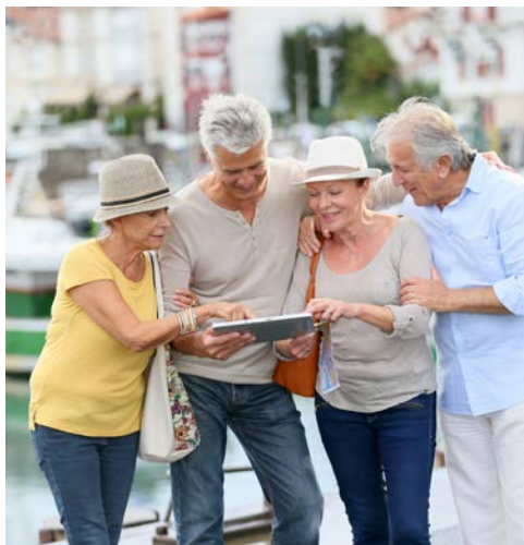
Unterwegs auf Entdeckungstour

Frühstück im Hotel, anschließend nehmen Teilnehmer des Ausflugspaketes an dem Ausflug zur Insel Symi teil: Sie werden mit dem Bus zum Hafen von