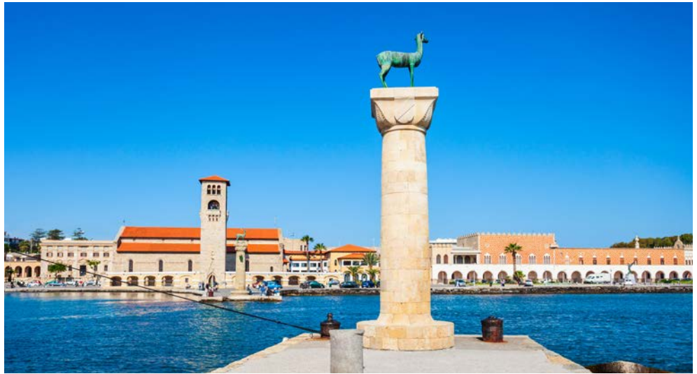
Hier soll der Koloss von Rhodos gestanden haben – eines der sieben Weltwunder

Wer kennt nicht den „Koloss von Rhodos“, eines der sieben Weltwunder des Altertums. Er schmückte die Hafeneinfahrt der Hauptstadt und war ein Symbol für die Macht der Insel in der Antike. Heute ist Rhodos eine beliebte Urlaubsinsel und bietet neben strahlendem Sonnenschein auch kulturelle Höhepunkte und landschaftliche Schönheiten. Genießen Sie ein paar unvergessliche Tage und lassen Sie sich von der griechischen Gastfreundschaft verwöhnen.