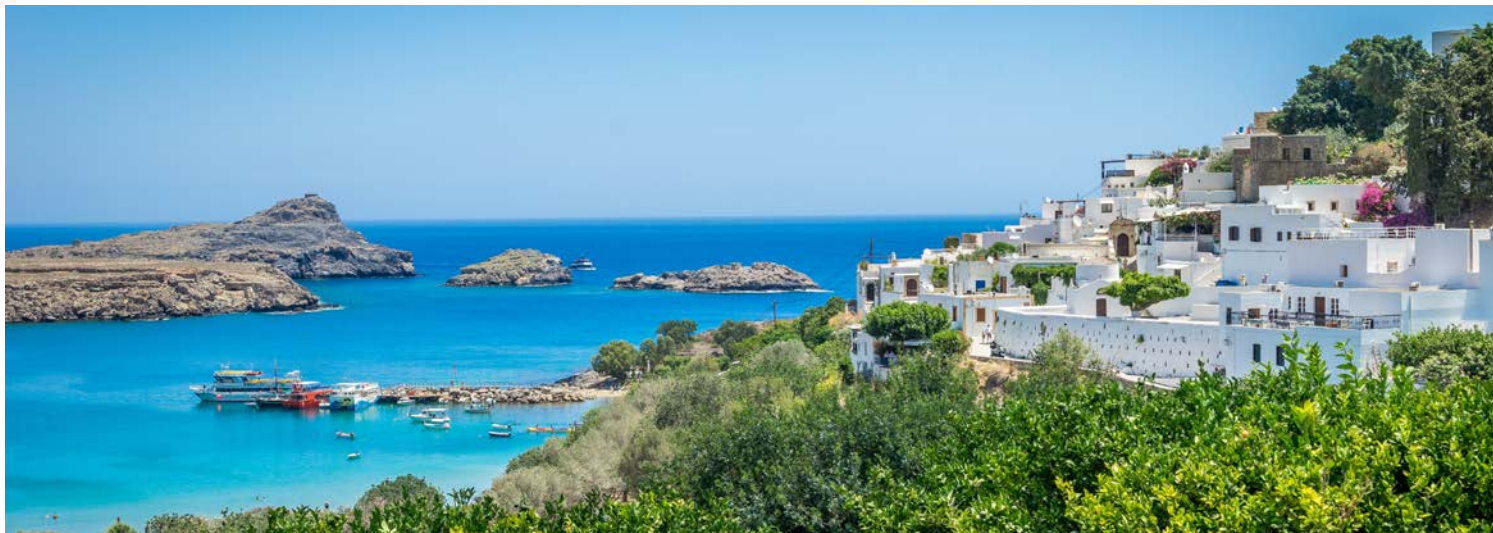
Blick auf die weiße Stadt Lindos