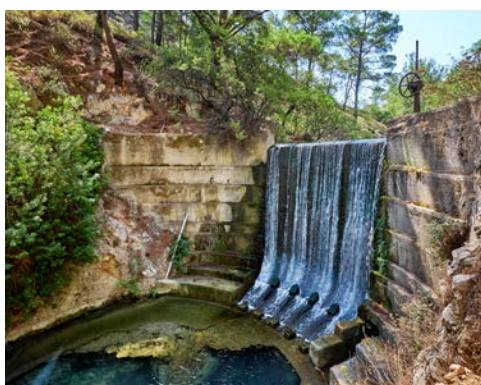
Epta Piges – Tal der sieben Quellen

Phountoukli besichtigen Sie die byzantinische Kirche mit ihren schönen Wandmalereien und in Monolithos sehen Sie die mächtige Johanniterfestung spektakulär auf einer Felspitze gelegen. Mittagspause machen Sie im Weindorf Embona, wo Sie Ihr landestypisches Meze-Mittagessen mit einem Glas Ouzo in einer Taverne zu sich nehmen. Abendessen und Übernachtung im Hotel.