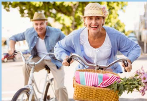
Entdecken Sie Holland per Rad