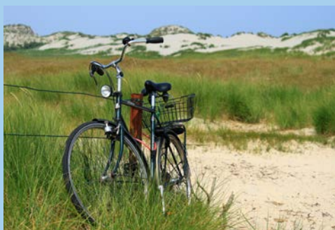
Abstecher an die Nordseeküste