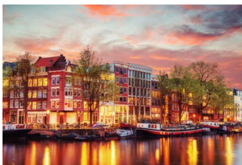
Das bezaubernde Amsterdam

Heute stehen zwei Radtouren zur Auswahl. Beide Touren führen durch die zauberhaften Kennemerdünen, einem Naturschutzgebiet mit vielen Vögeln, schottischen Hochlandrindern und Shetlandponys. Nachdem Sie die Badeorte Bloemendaal aan Zee und Zandvoort besucht haben, fahren Sie durch Wälder und das Zentrum von Haarlem zurück zum Schiff. Bei der etwas längeren Tour führt Sie die Strecke auch zum historischen Pumpwerk De Cruquius, der größten Dampfmaschine der Welt. Während des Abendessens fährt das Schiff nach Zaandam. Wer Lust hat, kann von Haarlem aus auch die berühmte Tulpenausstellung „Keukenhof“ bei Lisse besuchen* (mit dem Fahrrad oder mit dem öffentlichen Nahverkehr; Fahrtkosten und Eintrittspreis „Keukenhof“ sind nicht inklusive).