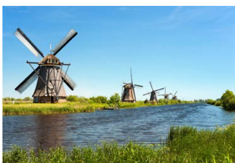
Windmühlen in Kinderdijk