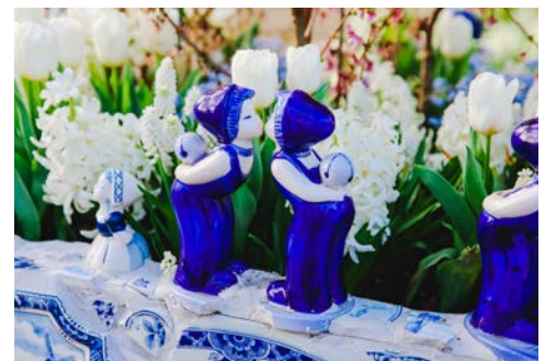
Delfter Porzellan – vielleicht ein Souvenir für daheim?

Heute geht es mit dem Rad von Schoonhoven durch das bezaubernde „Grüne Herz“ entlang kleiner Dörfer und über ruhige Wege und Landstraßen nach Utrecht. Unterwegs können Sie einen traditionellen Bio-Käsebauernhof und das Hexenwaage-Haus in Oudewater besuchen. Am späten Nachmittag fährt das Schiff von Utrecht nach Haarlem.