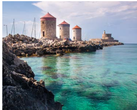
Drei Mühlen auf der Mole am Hafen von Rhodos Stadt

Nach dem Frühstück erfolgen, je nach Rückflugzeit, der Transfer zum Flughafen und der Rückflug nach Hannover und Busfahrt nach Göttingen.