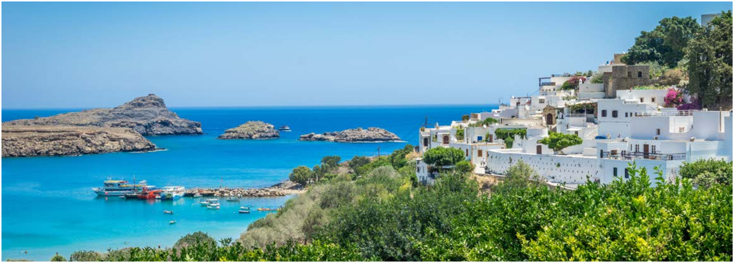
Blick auf die weiße Stadt Lindos