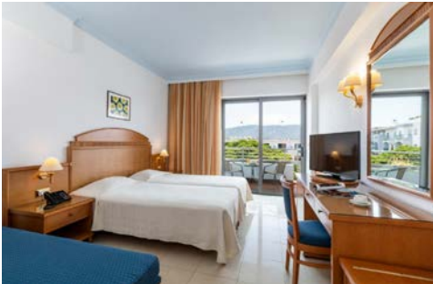
Frühstücksbuffet (oben), Zimmerbeispiel (unten)