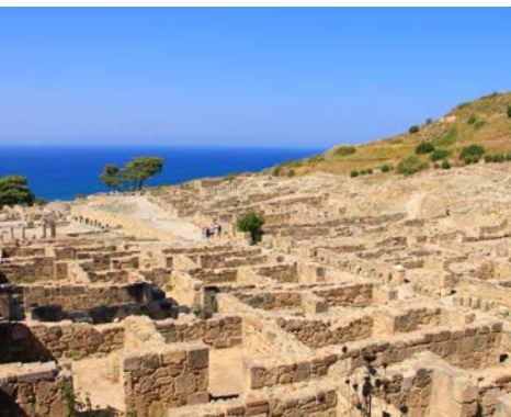
Ausgrabungen von Kamiros

Falls gebucht, geht es für Sie heute in das am Stadtrand von Rhodos auf einem 267 Meter hohen Hügel gelegene Filerimos. Hoch oben befinden sich das byzantinische Kloster von Filerimos und die Überreste des Tempels Athena Polias, welcher einst zur antiken Stadt von Ialysos gehörte. Von hier aus genießt man einen fantastischen Ausblick auf das Ägäische Meer. Danach geht es in das Tal der Schmetterlinge, welches nach den vielen Faltern benannt wurde, die im Juli zu Millionen die Gegend bevölkern. Dort unternehmen Sie eine kleine Wanderung durch die beeindruckende Schlucht. Abschließend besuchen Sie die antike Stadt Kamiros, wo Sie Relikte aus dem 6. Jahrhundert v. Chr. besichtigen können. Abendessen im Hotel.