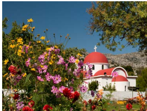
Kloster Vidiani in der Lassithi Hochebene

Erstes Ziel dieser abwechslungsreichen Fahrt ist das Kloster Arkadi. Es wurde während der Aufstände gegen die türkische Herrschaft zum Symbol des kretischen Freiheitskampfes und ist heute kretisches Nationalheiligtum. Nach kurzer Fahrt erreichen Sie Rethymnon. Lassen Sie sich bezaubern vom ganz besonderen Flair der vollständig erhaltenen Altstadt