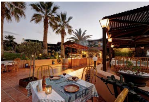
Terrasse des Hotels