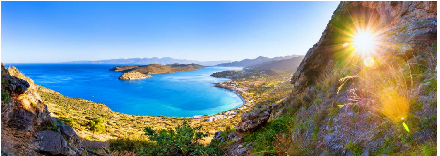
Blick auf Spinalonga