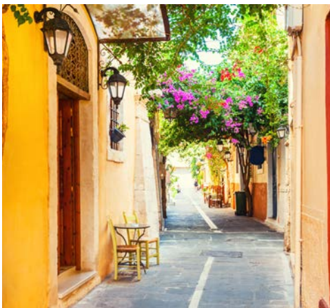
Schmale Gasse in Rethymnon

Genießen Sie diesen Tag auf eigene Faust, erholen Sie sich am Strand oder in der Hotelanlage.