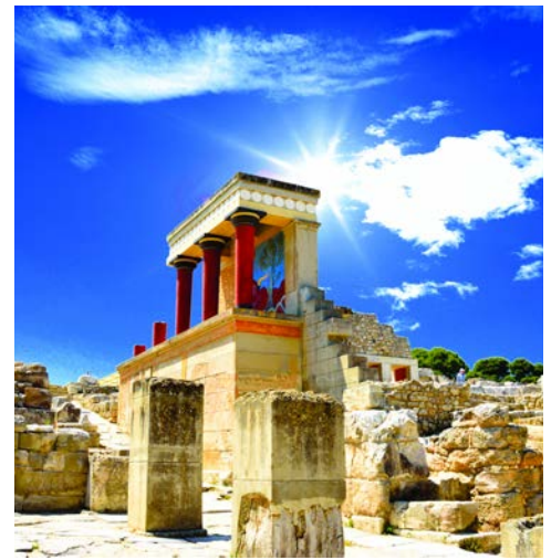
Knossos wird Sie faszinieren

Ein Ausflug, auf dem Sie die wunderschöne Landschaft Kretas und ihre archäologischen Stätten besichtigen. Von Heraklion aus fahren Sie in Richtung Süden durch das Weinanbaugebiet nach Gortys, der einstigen griechisch-römischen Hauptstadt der Insel. Weiter geht es nach Matala. Das idyllische Städtchen war in den 1970er Jahren die Hochburg für Hippies. Diese wohnten in Höhlen am Strand, welche Sie auf diesem Ausflug besuchen können.