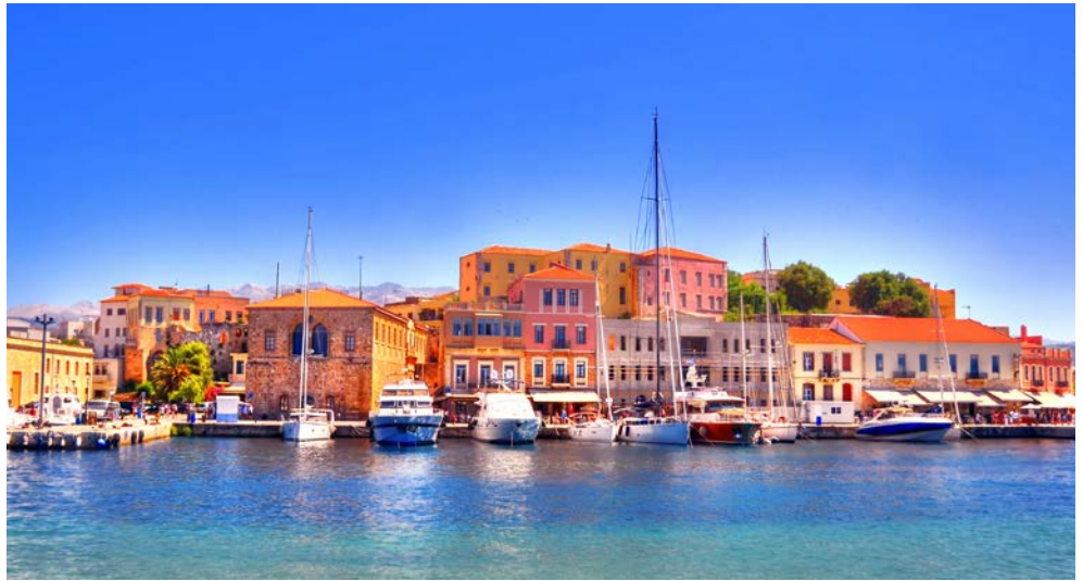
In der Bucht von Chania

so intensiv blau leuchtet das Meer rund um Kreta, dass sich das Herz des Besuchers vor Sehnsucht zusammenzieht. Auf der größten griechischen Insel ist viel Platz für kilometerlange Sandstrände an der Nordküste und für malerische Buchten zwischen steilen Klippen im Süden. Dazwischen erheben sich über 2.000 m hohe Berge mit wildromantischen Schluchten und fruchtbarem Hügel-land. In dieser großzügigen Natur entwickelte sich vor 4.000 Jahren die erste europäische Hochkultur: Das minoische Reich beeindruckt selbst als Ruine wie dem monumentalen Palast von Knossos. Entsprechend stolz ist der Kreter auf seine Vorfahren und auf seine Heimat, deren Schönheiten er gerne den Besuchern zeigt. Eine der landschaftlich schönsten Inseln im Mittelmeer erwartet Sie!