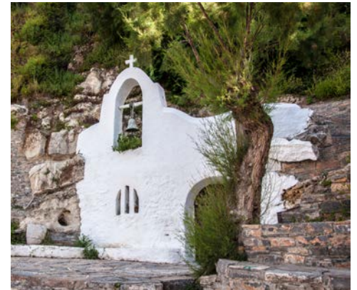
Kleine Kapelle in Agios Nikolaos