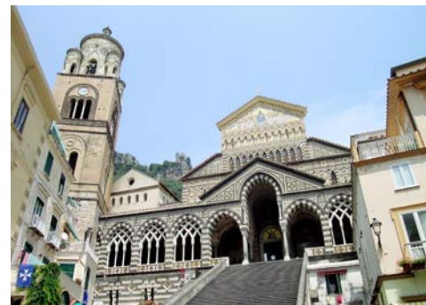
Dom von Amalfi

Flugplan-, Hotel- und Programmänderungen vorbehalten. An- und Abreisetage dienen ausschließlich der Erbringung der vertraglichen Beförderungsleistungen. Je nach Fluggesellschaft und Flugdauer werden Bordverpflegung und Getränke nur gegen Bezahlung angeboten. Stand 01/22 - alle Angaben ohne Gewähr.