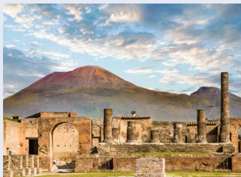
Pompeji und Vesuv – ein Muss für jeden!

Sie gilt zu Recht als eine der schönsten Inseln des Tyrrhenischen Meeres. Capri hat bis heute nichts von seiner Anziehungskraft verloren. Der Ausflug auf die Insel startet mit einer Busfahrt zum Hafen von Sorrent. Dort wartet das Schnellboot, das nach kurzer Fahrt im malerischen Hafen von Marina Grande anlegt. Über die steil ansteigende Serpentinstraße erreichen Sie Anacapri. Durch die Ausführungen Ihres Reiseleiters erhalten Sie einen ersten Eindruck von den Besonderheiten der Villa San Michele, die einst vom schwedischen Arzt und Schriftsteller Axel Munthe bewohnt wurde. Heute befindet sich ein Museum im Haus, das viele interessante Artefakte und Kunstwerke beherbergt. Per Bus geht es weiter nach Capri-Dorf. Zunächst führt hier ein kurzer Spaziergang an der dortigen Piazzetta entlang. Von den Augustusgärten aus genießen Sie einen herrlichen Blick auf die bekannten Faraglioni Felsen. Im Anschluss bleibt genug Zeit, um je nach Wunsch eine Kleinigkeit zu essen oder individuell den charmanten Ort mit seinen kleinen Gassen und Cafés zu durchstreifen. Am Nachmittag verlassen Sie das malerische Capri und kehren mit dem Schnellboot aufs Festland zurück. Am Hafen von Sorrent stehen Kleinbusse für den Transfer ins Hotel bereit.