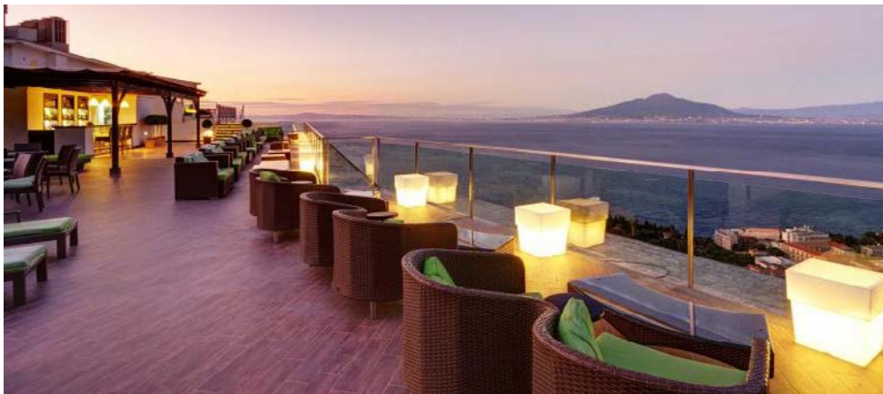
Herrlicher Ausblick von der Dachterrasse