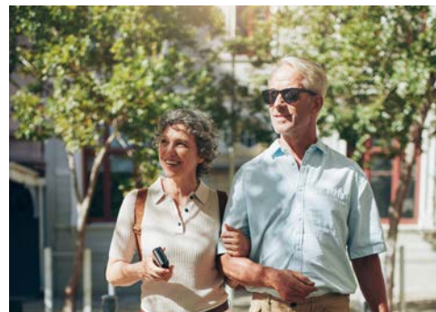
Freuen Sie sich auf schöne Erlebnisse

Heute endet Ihre erlebnisreiche Reise mit der Heimreise nach Deutschland.