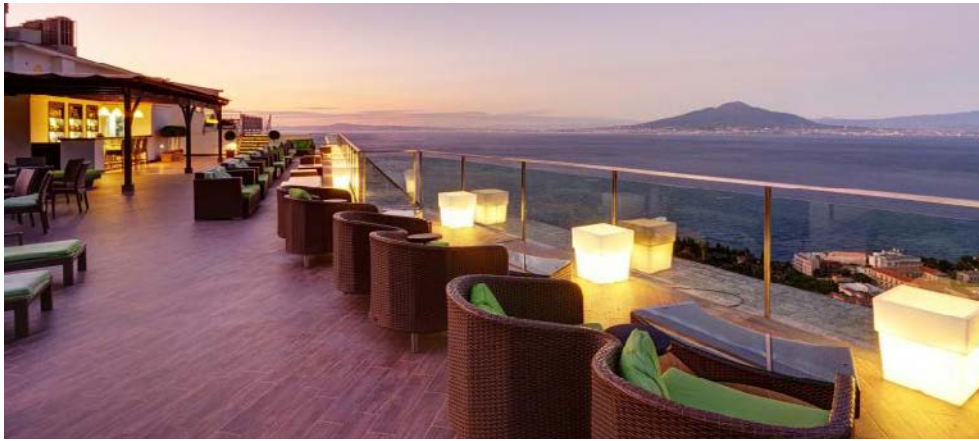
Herrlicher Ausblick von der Dachterrasse