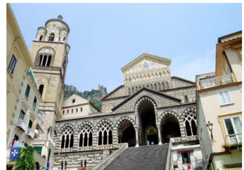
Dom von Amalfi

Flugplan-, Hotel- und Programmänderungen vorbehalten. An- und Abreisetage dienen ausschließlich der Erbringung der vertraglichen Beförderungsleistungen. Je nach Fluggesellschaft und Flugdauer werden Bordverpflegung und Getränke nur gegen Bezahlung angeboten. Stand 07/22 – alle Angaben ohne Gewähr.