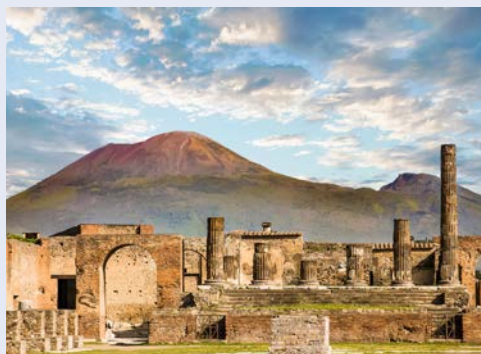
Pompeji und Vesuv – ein Muss für jeden!

Per Kleinbus geht es nach Sorrent und Sie unternehmen einen geführten Stadtpaziergang zu den wichtigsten Sehenswürdigkeiten des charmanten