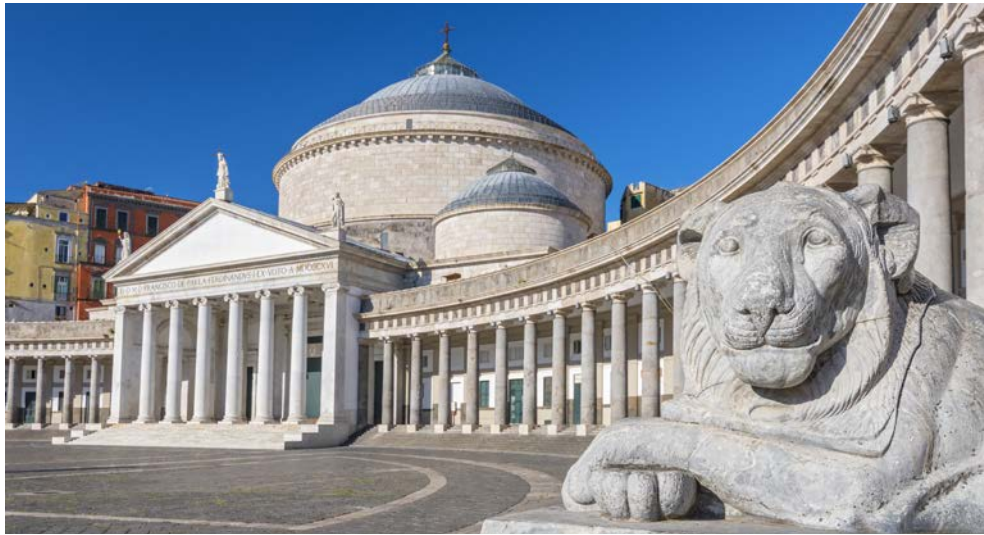
Neapel – Piazza Plebiscito