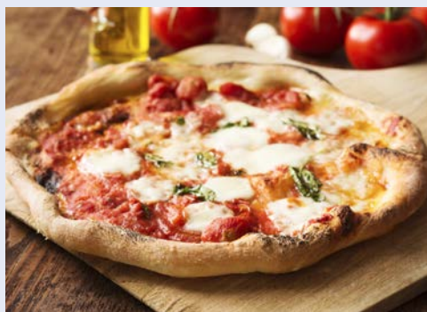
Ein Klassiker – Pizza Napoletana