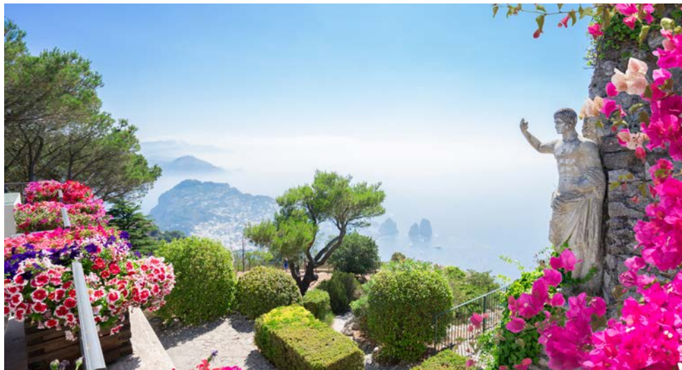
Capri – traumhafte Aussichten von den Augustusgärten

Seit Jahrhunderten inspiriert die Schönheit des Golfs von Neapel Literaten und Musiker aus ganz Europa. Die einzigartige Kulturlandschaft besticht durch prachtvolle Blütengärten, bizarre Felsformationen und ein azurblaues Meer. Verschlungene Küstenstraßen führen durch Orangen- und Zitronenhaine zu Stätten antiker Geschichte. Kampanische Bauern bewirtschaften ihre Gärten und Höfe in der zerklüfteten Küstenlandschaft seit Generationen. Ob Mozzarella oder Limoncello, hier kommen die Gaben der Natur direkt auf den Tisch. Über all dem thront der Vesuv, sagenhafter Mythos und Ehrfurcht erregende Naturgewalt. Idealer Ausgangspunkt, um diesen reizvollen Landstrich Kampaniens intensiv zu erkunden, ist Sorrent. Ein malerischer Ort, der imposant auf einem Felsplateau liegt. Ganz in der Nähe gründeten die Römer die mondäne antike Stadt Pompeji, deren durch Asche konservierte Architektur die Besucher noch heute in die untergegangene Kultur eintauchen lässt. Spätere Könige, Päpste und Fürsten prägten mit dem Bau gotischer Kirchen und barocker Prachtbauten die Altstadt von Neapel. In kleinen Bergdörfern überdauerten zudem die Bauwerke der Normannen und Mauren die Jahrhunderte. Und auf der wohl schönsten Insel des Tyrrhenischen Meeres, auf Capri, finden sich bis heute Spuren früher Bewunderer der einzigartigen Natur. Hier verbrachten im 19. Jahrhundert sowohl der schwedische Schriftsteller Axel Munthe als auch der deutsche Industrielle Friedrich Alfred Krupp ihre wohl schönsten Lebensjahre.