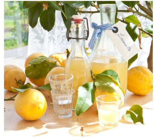
Limoncello – Schon probiert?

Reiseveranstalter: Hanseat Reisen GmbH, Langenstraße 20, 28195 Bremen.