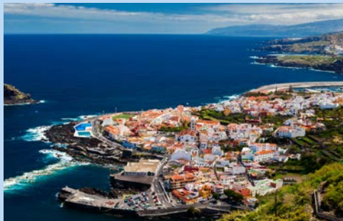
Blick auf das herrlich gelegene Garachico

Freuen Sie sich heute auf eine umfassende Tour, die mit der Fahrt zur Gemeinde Icod de los Vinos und nach einem kurzen Aufenthalt am tausendjährigen Drachenbaum startet. Der bekannte Aussichtspunkt Mirador de Garachico erwartet Sie im Anschluss. Ihr Tagesausflug führt Sie weiter in den gebirgigen Nordwesten Teneriffas. Diese Region ist besonders unwegsam und daher kaum besiedelt. Um so faszinierender ist die wild zerklüftete, einst von Vulkanen geprägte