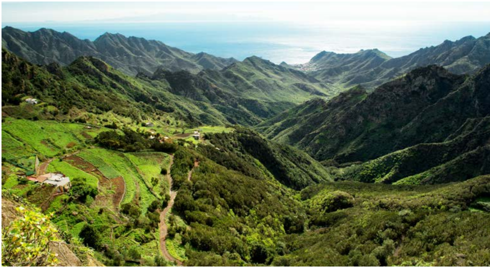
Das grüne Anagagebirge