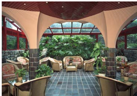
Gemütliche Loungebereiche im Hotel