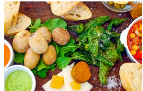
Typisch auf den Kanaren - Schrumpekartoffeln mit Mojo

Flugplan-, Hotel- und Programmänderungen vorbehalten. An- und Abreisetag dienen ausschließlich der Erbringung der vertraglichen Beförderungsleistungen. Je nach Fluggesellschaft und Flugdauer werden Bordverpflegung und Getränke nur gegen Bezahlung angeboten. Stand 09/19 - alle Angaben ohne Gewähr.