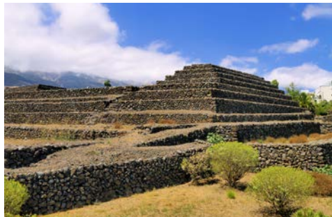
Pyramiden von Güimar

Danach geht die Fahrt nach Güimar. Dort befindet sich der ethnographische Park „Pirámides de Güimar“, welcher 1998 von dem angesehenen norwegischen Forscher Thor Heyerdahl gegründet wurde. Der Park hat ein Museum, ein Auditorium, mehrere Routen durch großzügige Grünanlagen und vieles mehr zu bieten. Sie besuchen auch den Giftgarten, in dem