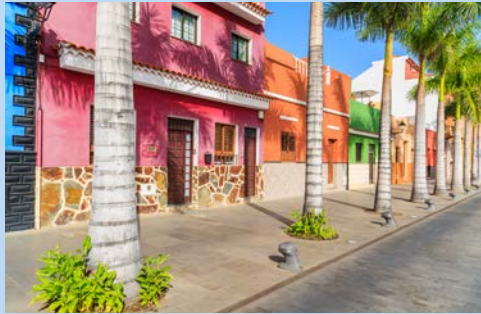
Farbenfrohes Puerto de la Cruz

Während der immer etwas wärmere Süden eher trocken, fast wüstenartig erscheint, sprießen im feuchten Norden Pflanzen in jeglicher Fassung. Das Inselinnere besticht mit dem Pico del Teide, schroffen Felsen und dichten Wäldern. Besonders beeindruckend ist natürlich der Teide-Nationalpark sowie das grüne Anagagebirge. Egal, ob Erholungssuchender, Naturbegeisterter oder Freunde der kulturellen Streifzüge – auf Teneriffa sind Sie richtig.