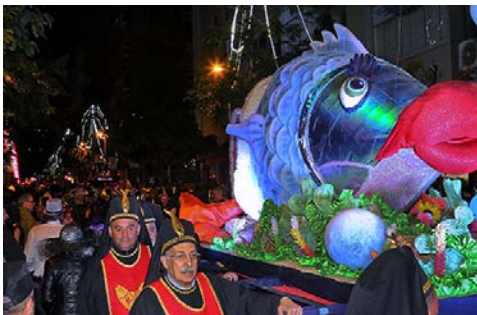
Begräbnis der Sardine

Prozession von Fackelträgern, wehklagenden Witwen und Trauergästen in Trauerkleidung begleitet durch die Straßen getragen wird. Dem Trauerzug folgen geschmückte Festwagen mit Musikanten und Tanzgruppen, in deren Tross Gaukler und Narren in volkstümlichen Maskeraden allerlei Schabernack treiben. Das Fest endet in den späten Abendstunden bzw. frühen Morgenstunden, wenn die Fischfigur schließlich angezündet oder in manchen Küstenorten, wie etwa in Puerto de la Cruz, brennend aufs offene Meer hinaus gebracht wird.