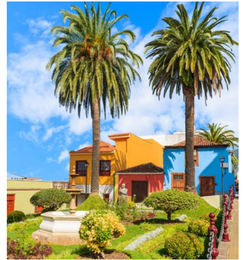
Wunderschönes La Orotava