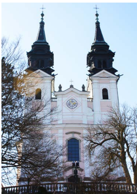
Die Basilika am Pöstlingberg in Linz

Freuen Sie sich heute auf faszinierende Eindrücke, die die Donauufer entlang der lieblichen Wachau und des Nibelungengaus hinterlassen, während Sie an Bord Ihres schwimmenden Hotels nach Linz gleiten.