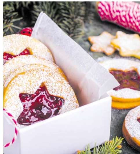
Linzer Keks – ein Genuss.

Geburts- und Hochzeits-Bonus sind nicht kombinierbar, je Kabine ist nur eine Ermäßigung möglich, Preisreduzierung gilt nur für die Schiffspassage. Eine Ausweiskopie oder Kopie der Heiratsurkunde muss bei Buchung vorgelegt werden. Nach Reisebeginn kann keine Erstattung erfolgen.