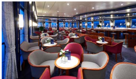
Lounge mit Aussicht

Kleidungsempfehlung: Leger-bequem. Zum Abendessen ist gepflegte Kleidung erwünscht, zum Galadinner ist dezente Eleganz angebracht. Die Bordsprache ist deutsch. Bordwährung: Euro. Als Zahlungsmittel an Bord werden Kreditkarten (Eurocard/Mastercard, VISA) sowie die deutsche EC-Karte (Maestro & V-Pay) akzeptiert.