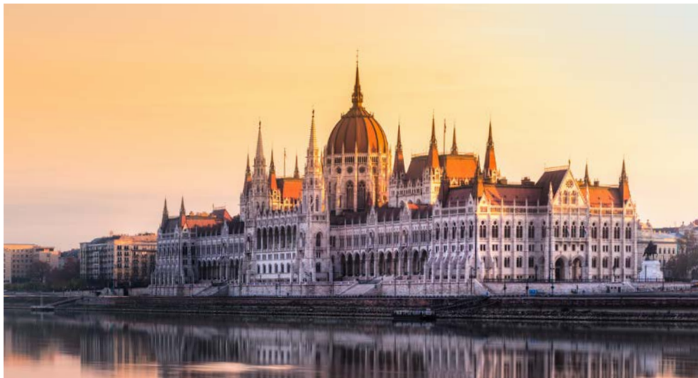
Das „Danau-Parlament“ in Budapest

Am Abend erreicht Ihr Schiff Wien und Sie haben Gelegenheit, die Christmette im Stephansdom zu besuchen. An Bord genießen Sie derweil den Heiligabend bei einem festlichen Galadinner.