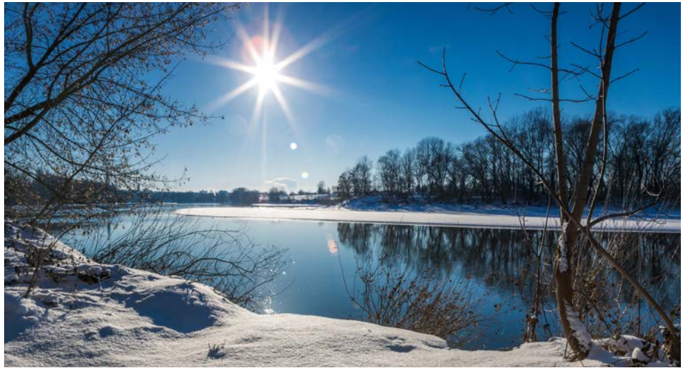
Mit etwas Glück fahren Sie durch verschneite Landschaften