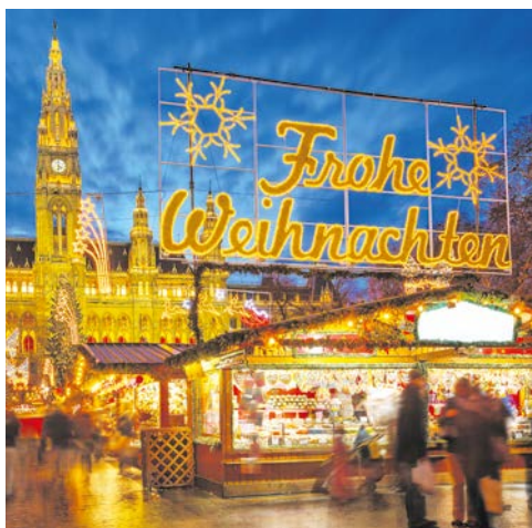
Christkindlmarkt Rathausplatz in Wien – auch über Weihnachten geöffnet

Am Abend erreicht Ihr Schiff Wien und Sie haben Gelegenheit, die Christmette im Stephansdom zu besuchen. An Bord genießen Sie derweil den Heiligabend bei einem festlichen Galadinner.