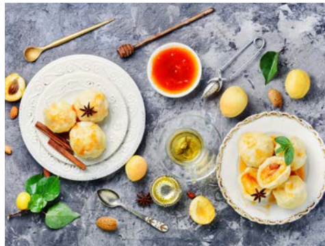
Probieren Sie die leckeren Marillenknödel der Region

Anreise wie ausgeschrieben. Nach der Einschiffung auf die VistaSun geht es zunächst durch die be- zaubernde Passage der Schlögenger Schlinge. Stehen Sie an Deck und genießen Sie die vorbeiziehende Landschaft und die sanfte Biegung des Flusslaufes.