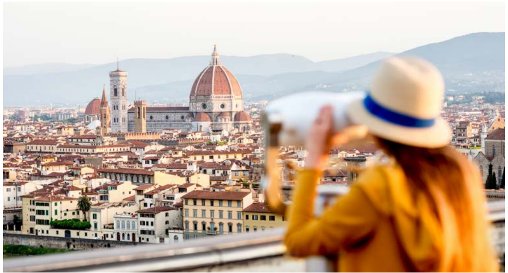
Wunderschöner Blick über Florenz

In Ihrem Hotel im schöngelegenen Kurort Montecatini Terme können Sie in eleganter Umgebung stilvoll die Seele baumeln lassen und Kultur und Kulinarik genießen!