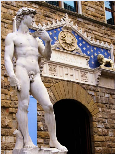
Der David von Michelangelo in Florenz

Gegen Mittag Weiterfahrt nach San Gimignano. Unterwegs legen Sie einen Stopp ein für eine Weinprobe des hervorragenden toskanischen Weins, zu dem auch ein kleiner Imbiss gereicht wird. Nachmittags erkunden Sie San Gimignano, dessen hoch aufragende Geschlechtertürme aus dem Mittelalter bereits aus der Ferne zu sehen sind. Bei einem