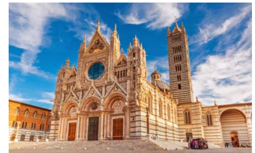
Der Dom in Siena

Sie beginnen Ihren gastronomischen Spaziergang in der Metzgerei Balestri und probieren verschiedene köstliche Schinken- und Salamiarten, zu denen Wein aus der lokalen Weinkellerei Ucelliera gereicht wird. Anschließend geht es zur Käserei Busti, wo uns eine Führung und Verkostung von verschiedenen typischen Käsesorten erwartet. Zwischendurch schauen wir uns das Castello dei Vicari an, das einen herrlichen Panoramablick bietet. Zum Schluss steht der Besuch des renommierten Pasta-Herstellers Martelli auf unserem Programm. Hier sind wir zum Abendessen zu Gast und genießen die Spezialität „Spaghetti Martelli al tafferuglio“. (F, A)