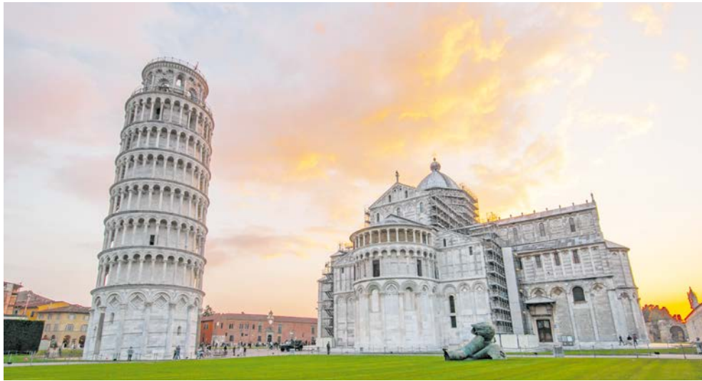
Ganz schön schief – der Turm von Pisa

Spaziergang durch die Altstadt mit ihren engen Gasen erleben wir die mittelalterliche Atmosphäre. Auf der Piazza della Cisterna sollten Sie unbedingt ein Eis aus der preisgekrönten Eisdiele von Sergio Dondoli probieren! (F, A)