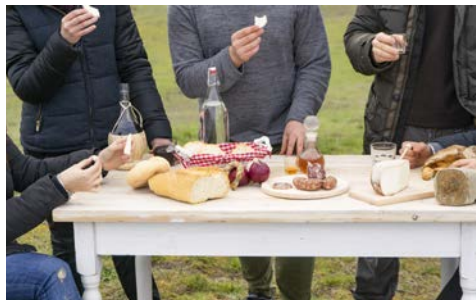
Kosten Sie toskanische Spezialitäten

Gleich zu Beginn Ihrer Reise geht es gegen Mittag in einen der schönsten und malerischsten Orte der Toskana, nach Lari, unweit von Pisa. Das mittelalterliche Dorf liegt inmitten grüner Hügel zwischen Zypressen, Olivenhainen und Weinbergen und bietet eine echte Einstimmung auf das „Dolce Vita“. Wunderschön ist es, sich auf der romantischen kleinen Piazza mit Blick auf das Castello, in dem auch die Medici weilten, auszuruhen oder in einer der Bars einen Cappuccino zu trinken und sich von der gelassenen italienischen Lebensart anstecken zu lassen. Lari ist aber auch berühmt für die Produktion verschiedener Qualitätsprodukte, die in Familienbetrieben nach dem Motto „Familie-Leidenschaft-Tradition“ hergestellt und weltweit exportiert werden.