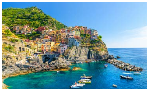
La Spezia in Cinque Terre

Heute erwartet Sie Pisa, die Geburtsstadt von Galileo Galilei. Der „Campo dei Miracoli“ (Platz der Wunder) mit den vier Monumenten aus weißem Carrara-Marmor – Dom, Taufkapelle, Glockenturm und monumentaler Friedhof – liegt am Westtor der mittelalterlichen Stadtmauer. Keine glückliche