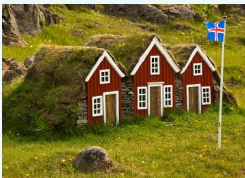
Willkommen in Island

Der Tag beginnt mit einem absoluten Highlight: an der weltberühmten Gletscherlagune Jökulsárlón machen Sie eine ca. 40-minütige Bootsfahrt, bei der Sie zwischen den Eisbergen hindurchfahren, die in der Lagune treiben. Hier sehen und hören Sie die Eisberge, die auf dem See Richtung Meer treiben und vom Gletscher Vatnajökull abbrechen. In der Sonne schimmern die Eisberge türkis und blau. Entlang den engen, gewundenen Straßen der Ostfjorde geht es