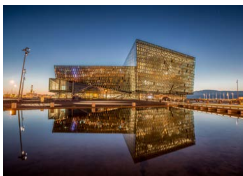
Konzerthalle Harpa in Reykjavik

Vom Norden geht es zurück in die Hauptstadt. Sie unternehmen eine Stadtrundfahrt. Das Highlight des Tages ist die Führung durch die Harpa Konzerthalle – die größte ihrer Art in den nordischen Ländern. Der Name „Harpa“ bedeutet Harfe und die Halle überzeugt mit ihrer einzigartigen Architektur. Sie hat zahlreiche Designpreise erhalten und ist bekannt für die exzellente Klangqualität in den Sälen. Am Ende der Tour genießen Sie ein kleines privates Konzert, welches Sie durch die musikalische Geschichte Islands führt. Eine Nacht im Hotel Fosshotel Baron/Raudará (Landeskategorie: 3 Sterne) in Reykjavik. Ca. 200 km