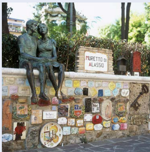
Wahrzeichen Alassios – Il Muretto

Nach dem Frühstück unternehmen Sie einen herrlichen Ausflug entlang der ligurischen Küste. Es geht zunächst nach San Remo – hier entdecken Sie bei einer Stadtbesichtigung die russisch-orthodoxe Kirche, das Spielkasino, die romanische Kathedrale von San Siro, die elegante Einkaufsstraße Via Matteotti und mehr. Anschließend haben Sie Zeit für einen entspannten Bummel. Im weiteren Verlauf der Küstenstraße durchqueren Sie Ospedaletti und den Luftkurort Bordighera (die „Stadt der Palmen“). Weiter fahren Sie ins ligurische Hinterland bis ins malerische Dorf Dolceacqua, welches durch die Gemälde von Claude Monet weltweit bekannt wurde. Die romanische Brücke, die Überreste der dominierenden Doriaburg und die mittelalterlichen Gässchen werden sicher bleibende Eindrücke hinterlassen. Bei einem kleinen Imbiss besteht auch die Möglichkeit, typische Spezialitäten und den Landwein Rossese zu kosten. Danach Rückfahrt ins Hotel.