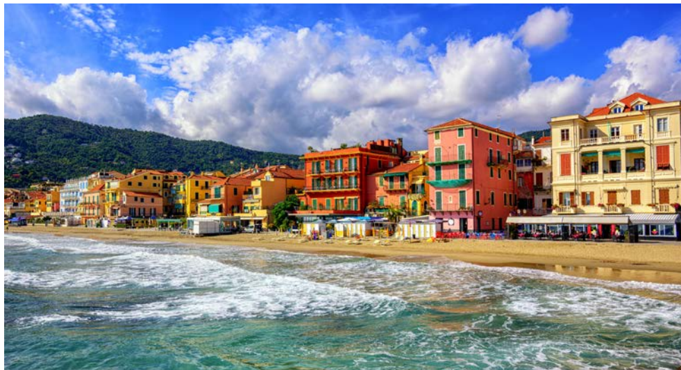
Ihr bezaubernder Urlaubsort Alassio

Weitere buchbare Ausflüge führen Sie in das einmalige Genua oder nach San Remo, durch Weinanbaugebiete und in pittoreske Bergdörfer. Genießen Sie die herrliche Landschaft der italienischen und französischen Riviera und lassen Sie sich von Kunst, Kultur und Lebensstil der Mittelmeerregion verzaubern.