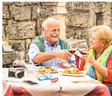
Die ligurische Küche ist ein Genuss

Nach dem Frühstück fahren Sie zurück nach Frankreich. Der Rückflug erfolgt von Nizza.