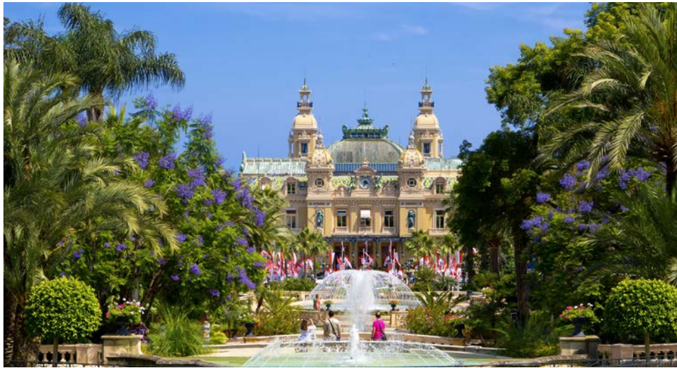
Das berühmte Kasino von Monte Carlo